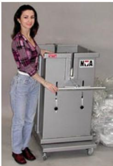
Kan enkelt flyttas och placeras där den gör mest nytta.