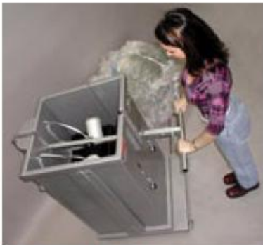
Pressplattan lossas genom ett enkelt handgrepp och ny ifyllnad kan ske. Hakar hindrar material från att jäsa upp.