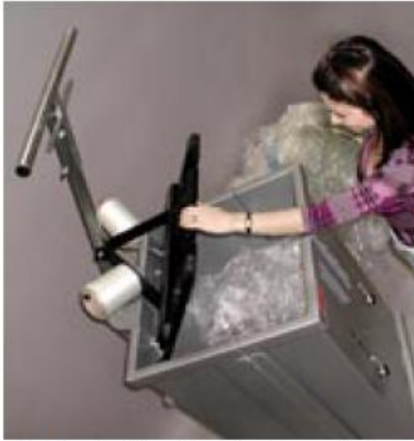
Fyll i material och tryck ned pressplattan. Automatisk spärr av pressplattan i nedre läget ger kompakta balar.