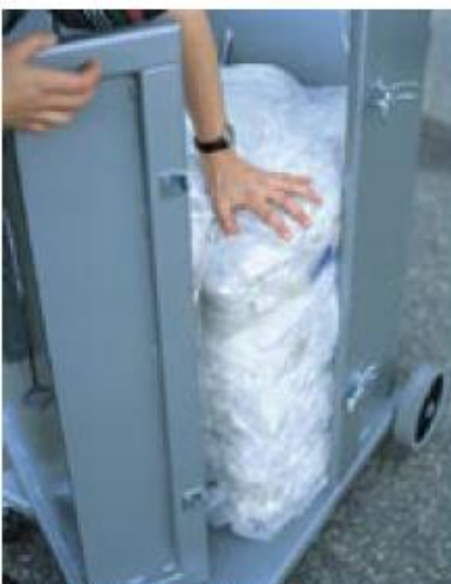
Balvikt under 25 kg