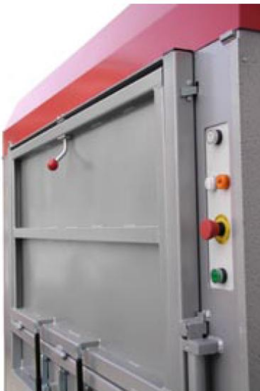
Ett rejält inkast, tydlig panel.

NPK 100 med den unika tysta och självsmörjande skruvdriften innehåller ingen hydraulik som kan orsaka kostsamma läckage.