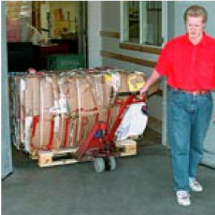
Stabila, stapelbara balar för god lagrings- och transportekonomi.